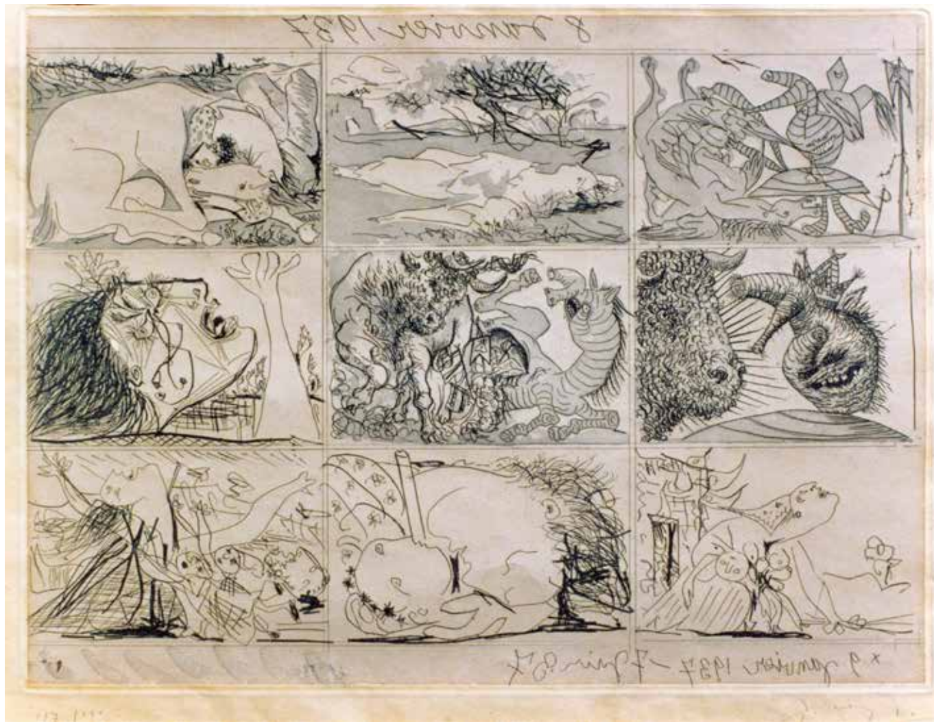
Sueño y mentira de Franco II - 1937 - Aguafuerte y aguatinta - 30,8 x 41,5 cm - Colección MEC